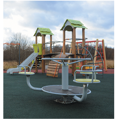
Детская площадка, д. Заболотье

Благоустройство делает городскую среду комфортной и уютной, одной из таких мер является установка детских площадок. На радость жителям деревни Заболотье для родителей и их детей появилась новая детская спортивно-игровая площадка. Современный, удобный и нужный объект обустроили вблизи дома № 19. Новый детский игровой комплекс теперь украшает ещё одну дворовую территорию и станет местом проведения активного досуга детворы разного возраста. Игровой комплекс возведён на мягком