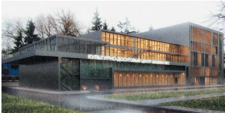
Проект нового Дома культуры

Современный культурно-досуговый центр возведут в поселении Михайлово-Ярцевское. В нём найдётся место и для библиотеки, и для большого концертного зала. Место под строительство определено, и даже есть конкретный адрес: посёлок Шишкин Лес, владение 35а. Архитекторы уже разрабатывают проект и продумывают детали внешнего вида нового здания.