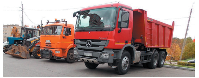
Смотр техники при подготовке к зиме проходит регулярно