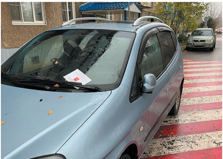
Парковка на стоянках для спецтехники запрещена

Пожарно-спасательный отряд № 308 ГКУ «ПСЦ» г. Москвы