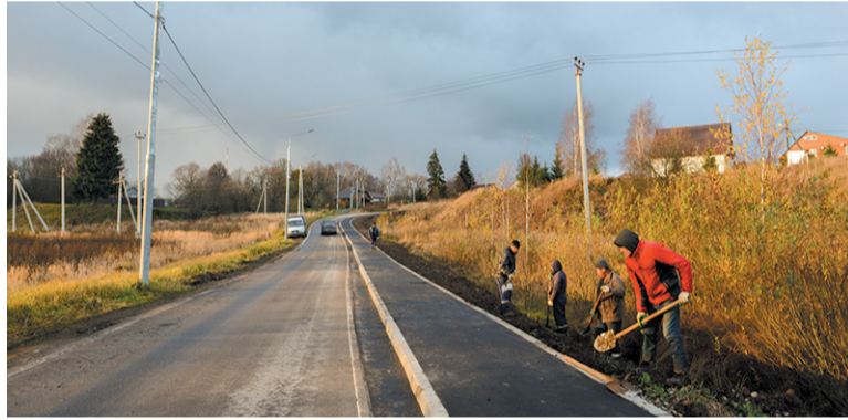
Новый тротуар в д. Сенькино-Секерино