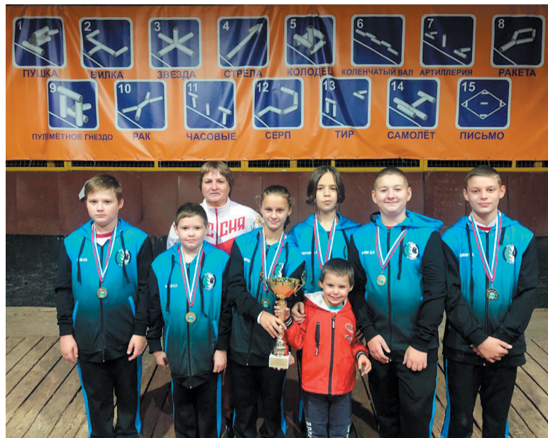
Финалисты соревнований по городошному спорту

Призовые места заняли наши спортсмены из разных возрастных групп. Особым успехом отличились местные городошники, вошедшие в состав сборной команды ТиНАО.