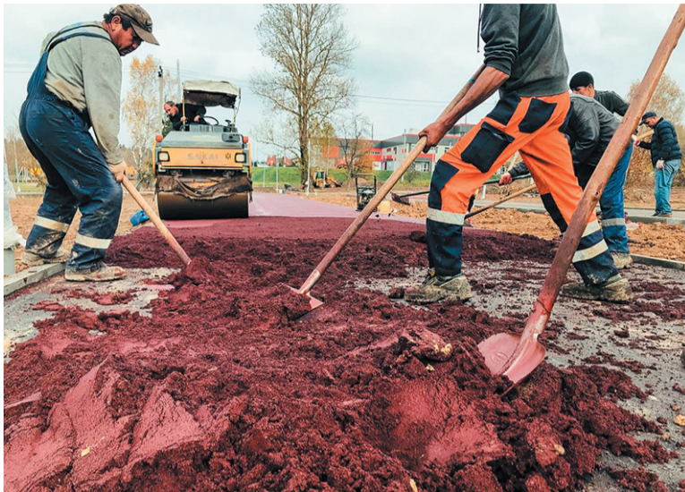
Асфальтирование верхнего слоя велодорожки

Решение о необходимости проведения комплексного благо-