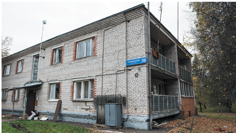
Дома в посёлке Армейский попали в первую очередь на расселение

Наталья НИКИФОРОВА