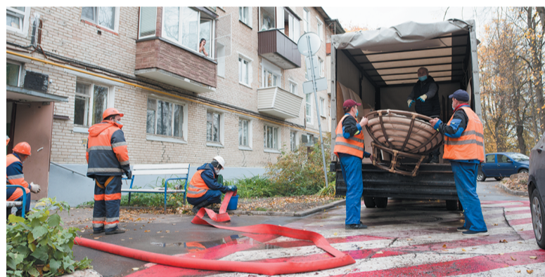
Для удобства переезда бесплатно предоставляются транспорт и грузчики