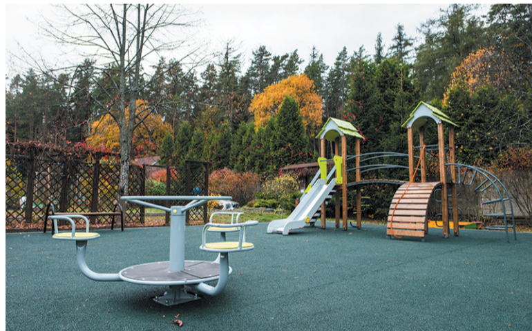
Детская площадка д. Дровнино, ул. Центральная, д. 19