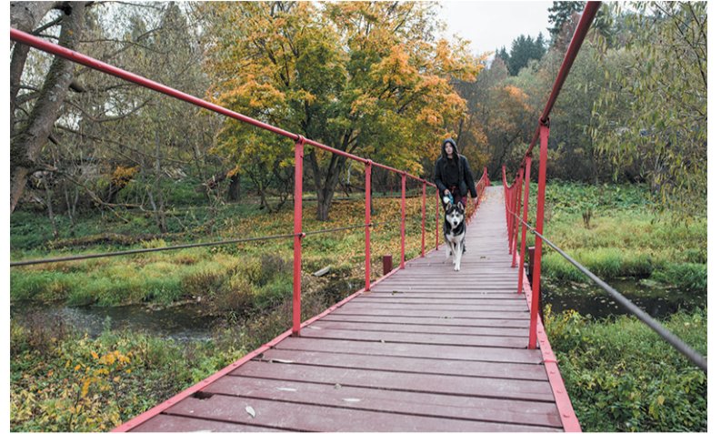
Подвесной пешеходный мостик пос. Шишкин Лес

Помимо этого, между территориями посёлка Шишкин Лес и деревни Конаково ещё в начале лета были произведены работы по реконструкции пешеходного подвесного моста, соединяющего данные населённые пункты. Комплекс мероприятий был направлен на восстановление покрытия всего моста и укрепление ограждающих элементов. Особое внимание уделено замене дощатого настила и натяжению тросов. Устройство же подходов к мосту со стороны деревни Конаково в связи с пан-